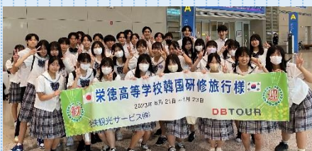
仁川(インチョン)国際空港にて