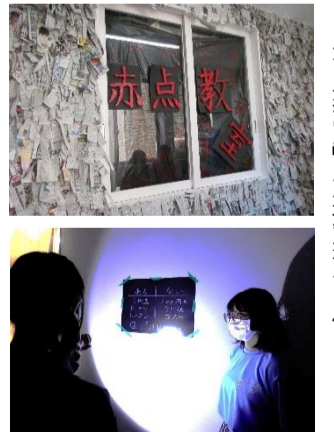
文化祭では1年生S文理クラス企画「赤点教室」が投票第2位に！

スーパージョー文理クラスは他のクラスとは違い毎日8限まで授業があります。また、土曜補習や合宿もあるため勉強がとても大変です。ですが第一志望の大学に合格したい、というクラス全員の共通目標があるので、仲間が助け合いながら頑張っています。9月には体育祭・文化祭があり、とても盛り上がりました。