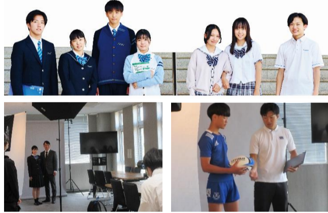
どのページの撮影かな？ 先生とポーズの相談です

登場する生徒は全員栄徳生。少し緊張しながらも、教員や卒業生と一緒に素敵な表情を見せています。こんな先輩たちと一緒に、楽しく充実した高校生活を送りませんか？