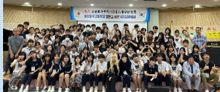
歓迎会も開いてくれました