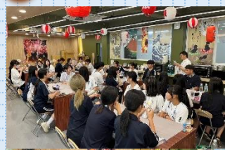
日韓かき氷作り対決！