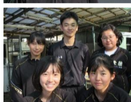
1年生マネージャー全員で