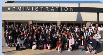
アメリカ修学旅行